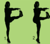
Frankstein walk 12X