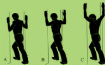
Pec stretch 40X