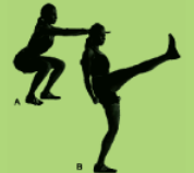
Squat & kicks 20X