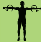
Arms circles 20X (10 x para a frente e 10 x para trás)