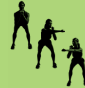
Squat & punch 20X