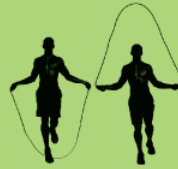
Rope jumps (com ou sem corda) 40X