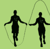
Rope jumps (com ou sem corda) 40X