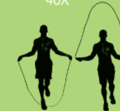
Rope jumps (com ou sem corda) 40X