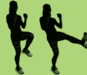
Alternating frontal kicks 20X