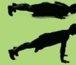
Push ups 10 a 20 X